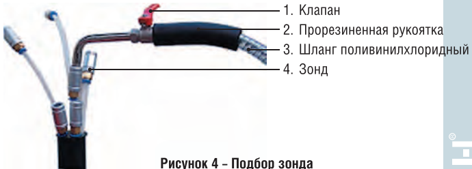
Рисунок 4 – Подбор зонда