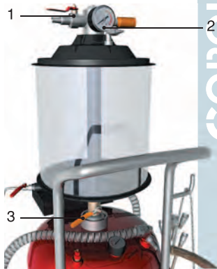
Рисунок 3 – Подключение установки