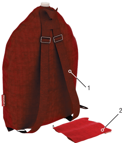
Рисунок 1 – Комплект поставки

ВНИМАНИЕ! Распаковав изделие, убедитесь в наличии всех деталей, согласно комплекту поставки. При отсутствии или поломке какой-либо детали немедленно свяжитесь с продавцом.